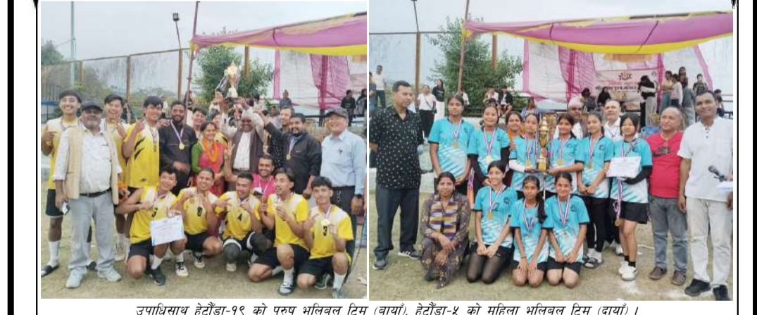
उपाधिसाथ हेटौंडा-१९ को पुरुष भलिबल टिम (बायाँ), हेटौंडा-५ को महिला भलिबल टिम (दायाँ)।

आठौँ संस्करणको उपमेयर कप भलिबल प्रतियोगितामा सहभागी भई महिलातर्फ उपाधि विजेता हेटौंडा-५ र पुरुषतर्फ उपाधि विजेता हेटौंडा-१९ लाई बधाई ज्ञापन गर्दै सहभागी सम्पूर्ण वडाका टिमप्रति आभार व्यक्त गर्दछौं। साथै आगामी दिनमा पनि सहभागिताको अपेक्षा राख्दछौं।