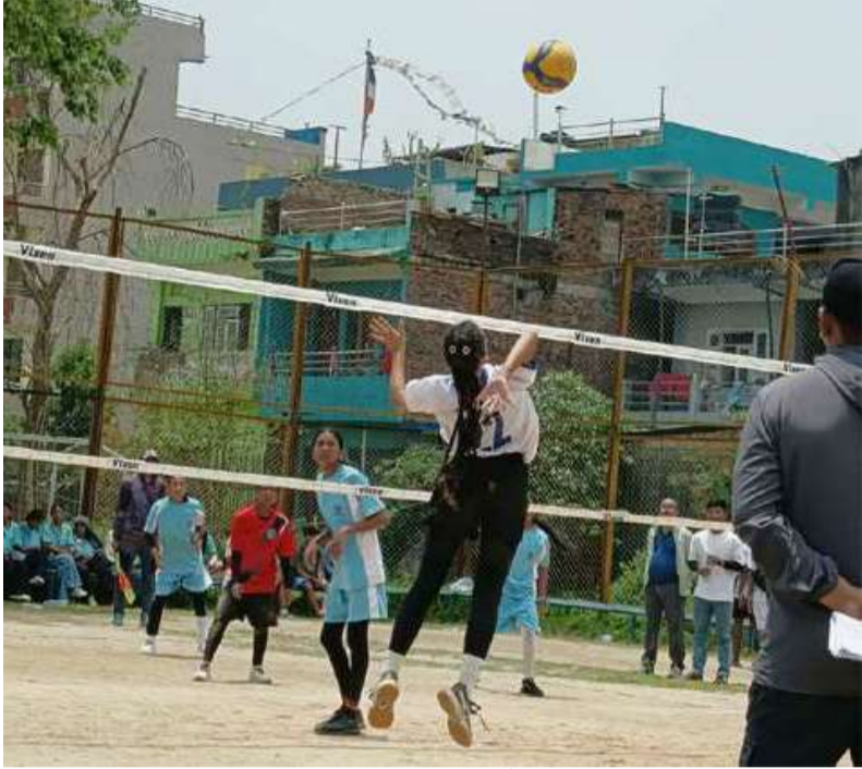
भलिबल खेलमा सट प्रहार गर्दै खेलाडी ।

समाज संवाददाता हेटौंडा: मकवानपुर जिल्लास्तरीय राष्ट्रपति रनिङ शिल्ड प्रतियोगिता अन्तर्गत भलिबलतर्फ फाइनल खेल्ने टोलीको टुङ्गो लागेको छ। मंगलबार सेमिफाइनलको खेलहरू सकिएसँगै छात्र र छात्रा दुवैतर्फको फाइनल खेल्ने टोलीको टुङ्गो लागेको हो। छात्रा भलिबलतर्फ भीमफेदी