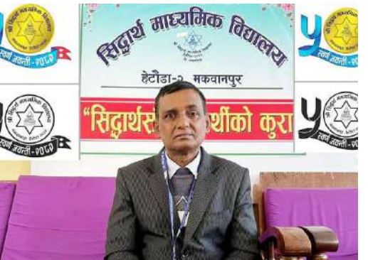
अभिभावकको पठनपाठनमा चासो पनि निकाै कम रहेको प्रधानाध्यापक कर्णको अनुभव छ। विद्यालयमा आफ्ना बालबालिकाका समस्या तथा पढाइबारे शिक्षकसँग अन्तर क्रियामा कुनै चासो नभएको पाइएको उहाँको भनाइ छ।

समाज संवाददाता हेटौडा : हेटौडा-२ स्थित सिद्धार्थ माध्यमिक विद्यालयले शैक्षिक सत्र-२०८२ मा स्वर्णजयन्ती मनायो। स्वर्णजयन्ती मनाउँदै गर्दा यो ऐतिहासिक कार्यक्रमको अभिभावकत्व लिन वैधानिक विद्यालय व्यवस्थापन समिति भने धिएन। वडा नम्बर २ कार्यालयले नै कार्यक्रमको अभिभावकत्व लिँदै कार्यक्रम सम्पन्न गर्‍यो।