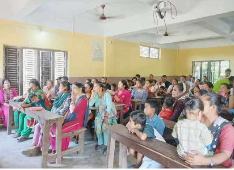
अन्तरक्रियामा सहभागी अभिभावकहरु ।