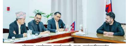
योजना आयोगका पदाधिकारी तथा कर्मचारीहरूसँग छलफलमा सहभागी प्रधानमन्त्री शाह।