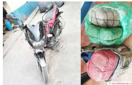
प्रहरीले नियन्त्रणमा लिएको मोटरसाइकल र बरामद भएको लागुऔषध गाँजा ।