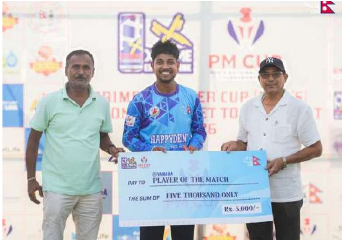
स्वयं अफ द म्याच सन्दिप एकलैलेलाई टफी हस्तान्तरण गरिदै ।