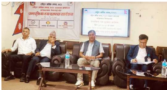
अन्तरक्रियामा सहभागी सरोकारवाला निकायका प्रतिनिधि ।