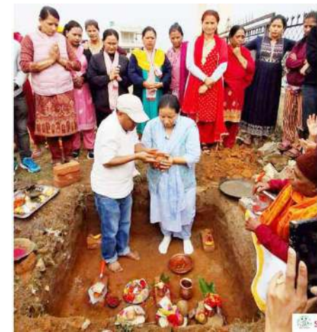
महिलामैत्री पार्क निर्माणका लागि शिलान्यास गर्नुहुँदै नगरप्रमुख लामा ।