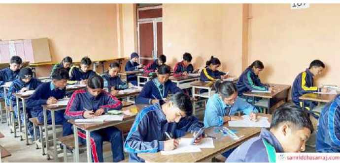
गत माघमा भएको एसईई अभ्यास परीक्षामा सहभागी विद्यार्थीहरू। फाइल तस्वीर।