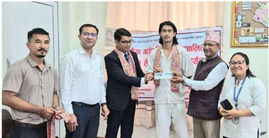
करदातालाई स्थायी लेखा नम्बर हस्तान्तरण गरिदै ।