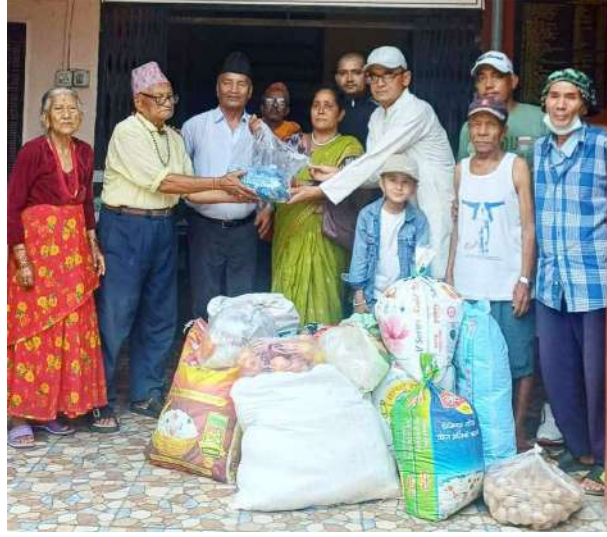
बृद्धाश्रमलाई खाद्यान्न सामग्री हस्तान्तरण गरिँदै ।