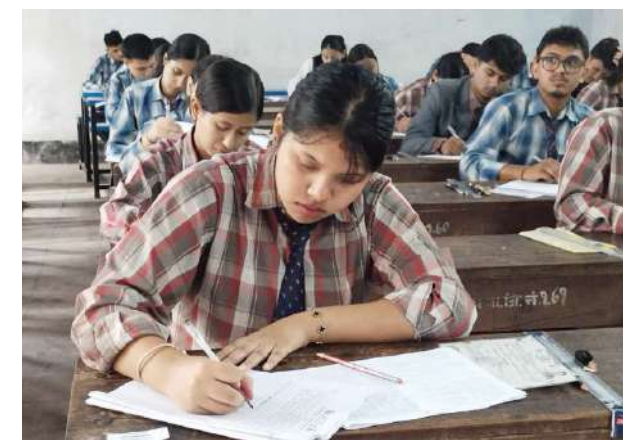
हेटौंडा-२ स्थित मकवानपुर बहुमुखी क्याम्पस परीक्षा केन्द्रमा परीक्षा दिँदै विद्यार्थी।

समाज संवाददाता हेटौंडा : कक्षा १२ को वार्षिक परीक्षा सोमबारबाट सुरु भएको छ। पहिलो दिन सोमबार अनिवार्य अंग्रेजी विषयको परीक्षा भएको छ। परीक्षा विहान ८ बजेदेखि सुरु भएको छ। मकवानपुर जिल्लामा १५ वटा परीक्षा केन्द्र निर्धारण गरिएको छ। मकवानपुरबाट कक्षा-१२ को परीक्षामा सहभागी हुन ५ हजार २६९ जना विद्यार्थीले फारम भरेका छन्। नियमिततर्फ ३ हजार ८२२ र