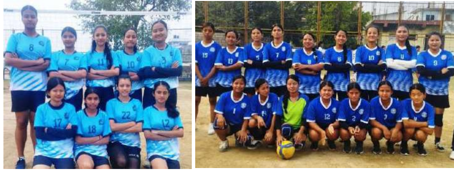
उपाधि भिडन्त पक्का गरेको हेटौंडा-५ (बायाँ) र हेटौंडा-१२ (दायाँ) को महिला भलिबल टिम।

समाज संवाददाता हेटौंडा : हेटौंडामा जारी उपमेयर कप भलिबल प्रतियोगिताको फाइनल खेल्ने टोलीको टुङ्गो लागेको छ। सोमबार सेमिफाइनलका खेलहरू सम्पन्न भएको हो। सेमिफाइनलका खेलहरू सकसँगै प्रतियोगितामा महिला र पुरुष दुवैतर्फ फाइनल खेल्ने टोलीहरूको टुङ्गो लागेको हो। जारी प्रतियोगितामा महिलातर्फ उपाधिका लागि हेटौंडा-५ र हेटौंडा-१२ भिडन्त हुनेछ। सोमबार हेटौंडा-४, हुप्रचौर स्थित भलिबल कोर्टमा भएको महिलोतर्फको पहिलो सेमीफाइनल खेलमा हेटौंडा-५ ले हेटौंडा-९ लाई २५-२२, २५-१८ र २५-१२ को सोभो सेटमा पराजित गर्दै फाइनल प्रवेश गरेको हो। सोमबार नै सम्पन्न