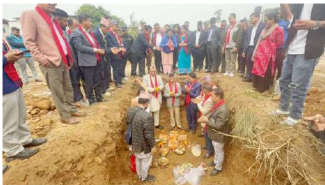
शैक्षिक भवनको शिलान्यास गरिँदै ।