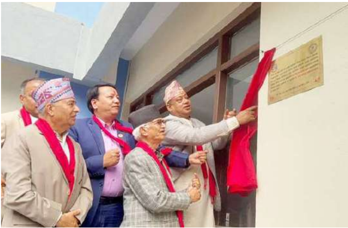
नवनिर्मित भवनको उद्घाटन गर्नुहुँदै मुख्यमन्त्री बानियाँ ।