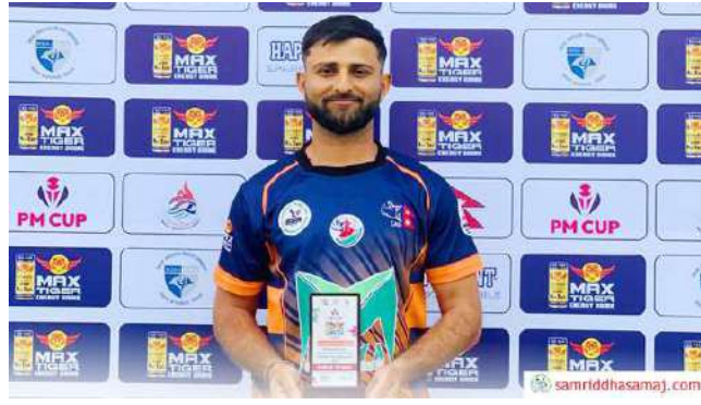
म्यान अफ द म्याचको टफीसहित मकवानपुरका शुभ कंसाकार ।