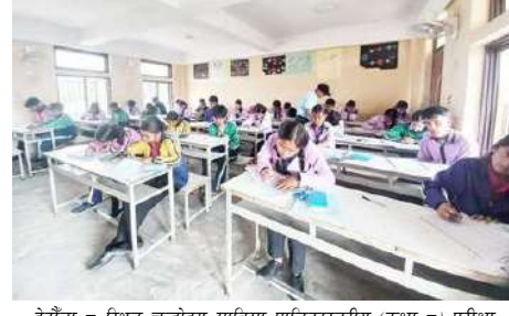
हेटौँडा-८ स्थित चन्द्रोदय माविमा पालिकास्तरीय (कक्षा-८) परीक्षा दिँदै विद्यार्थी।

हेटौँडा : मकवानपुर जिल्लाका पालिकाहरूमा आइतबारबाट पालिकास्तरीय (कक्षा-८) परीक्षा सुरु भएको छ। मकवानपुरका १० मध्ये ९ वटा पालिकामा पालिकास्तरीय वार्षिक परीक्षा आइतबारबाट सुरु भएको हो। परीक्षा १६ गते सम्पन्न हुने पालिकाका शिक्षा शाखा प्रमुखहरूले बताएका छन्।