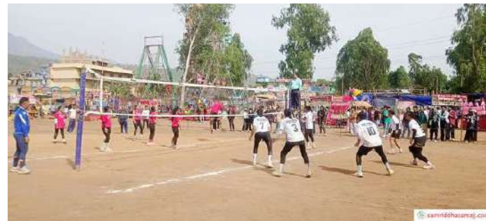
प्रतियोगिताअन्तर्गत उदघाटन खेलमा स्टेप रामपुर भलिबल क्लब र जिल्ला भलिबल संघ मकवानपुरबीचको खेल।