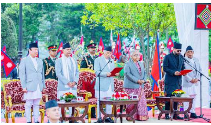
बालेन्द्र शाहलाई प्रधानमन्त्रीको सपथ गराउनुहुँदै राष्ट्रपति रामचन्द्र पौडेल।