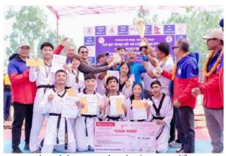
तेक्वान्दोमा प्रथम भएको काभ्रेलाई पुरस्कृत गरिँदै ।