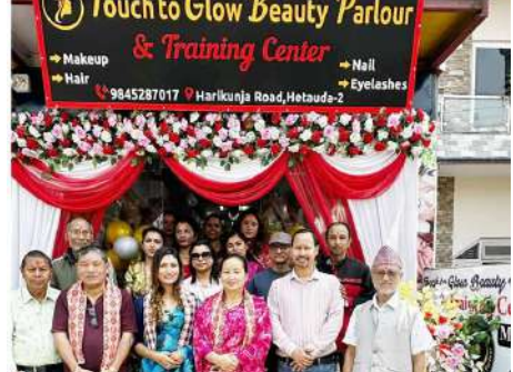
पालर उद्घाटनपछि नगरप्रमुख लामाले सामूहिक तस्वीर खिचाउँदै ।