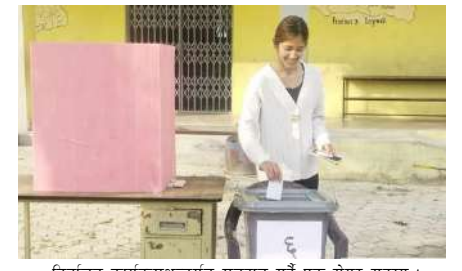
निर्वाचन कार्यक्रमअन्तर्गत मतदान गर्दै एक सेयर सदस्य ।