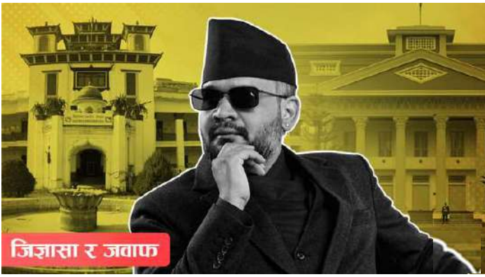
जिज्ञासा र जवाफ

काठमाडौं : प्रतिनिधिसभाको १६५ मध्ये १६३ निर्वाचन क्षेत्रको नतिजा सार्वजनिक भएको छ । समानुपातिकतर्फ करिब ९० प्रतिशत मतगणना सकिएको छ । निर्वाचन आयोगले आगामी साताभित्र अन्तिम निर्वाचन नतिजा प्रतिवेदन तयार पारेर राष्ट्रपतिलाई बुझाउने योजना बनाएको छ, त्यसपछि नयाँ सरकार गठन प्रक्रिया सुरु हुनेछ । निर्वाचन नतिजा, त्यसपछि नयाँ प्रधानमन्त्री चयन र नयाँ सरकार गठनको प्रक्रियाका बारेमा आमरूपमा चासो र सरोकार देखिएको छ ।