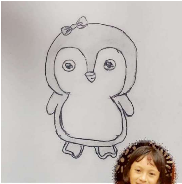
समृद्धि श्रेष्ठ कक्षा-४, ब्रह्मदिक एकेडेमी हेटौँडा-४