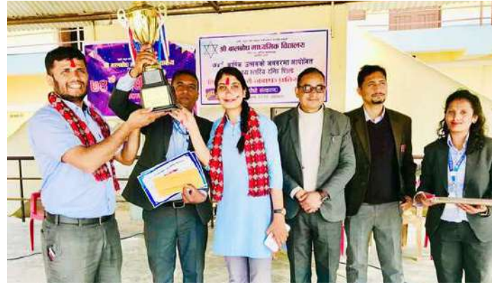
हाजिरीजवाफ प्रतियोगिताको विजेता शिक्षकलाई पुरस्कृत गरिँदै।