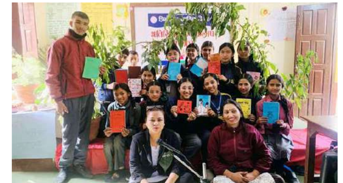
कथा चौतारीमा प्रस्तुत गर्ने कथा देखाउँदै विद्यार्थी।