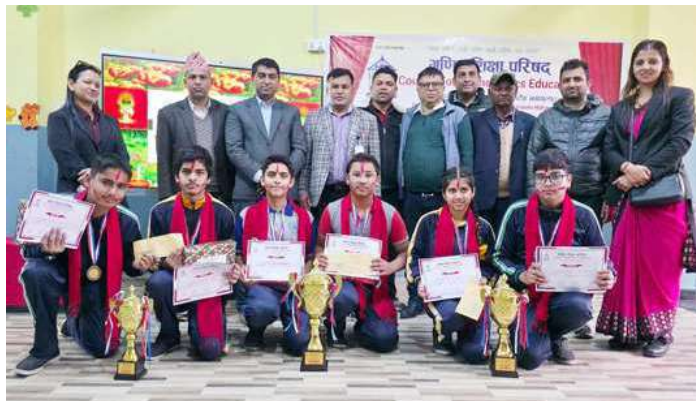
हाजिरीजवाफ प्रतियोगितामा विजयी समूहलाई पुरस्कार वितरणपछि खिचिएको सामूहिक तस्वीर।