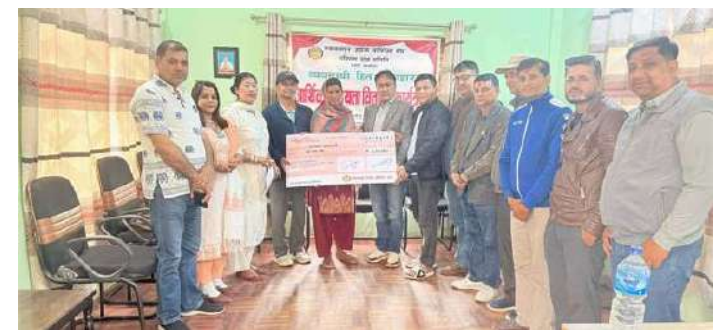
सहयोग रकम हस्तान्तरण गरिँदै।