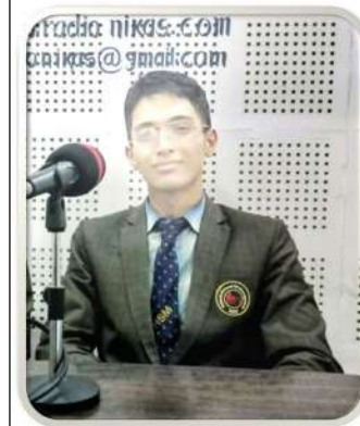
विमर्श श्रेष्ठ कक्षा-११ हेटौँडा स्कूल अफ म्यानेजमेन्ट

विमर्श श्रेष्ठ हेटौँडा स्कूल अफ म्यानेजमेन्टमा कक्षा ११ मा अध्ययनरत हुनुहुन्छ । विमर्श ११ कक्षामा विज्ञान