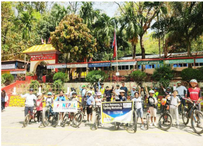
तालिममा सहभागी बालबालिकाहरू ।