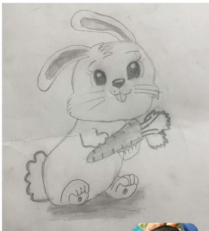
विहान कार्की कक्षा-४, कमाने एकेडेमी, हेटौँडा-८