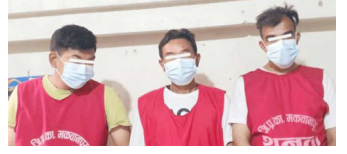
लागुऔषधसहित पक्राउ परेका तीनजना । समाज संवाददाता