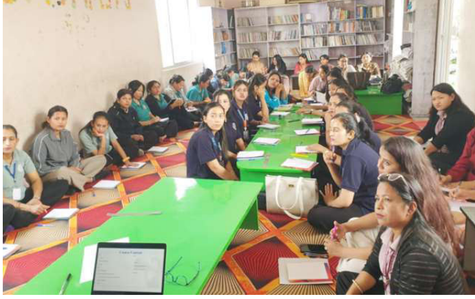
तालिममा सहभागी शिक्षकहरू ।