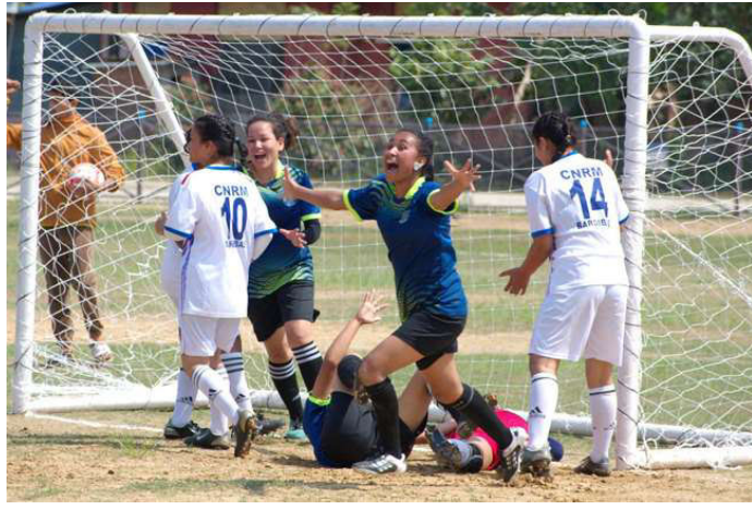
गोल गरेपछि खुसी हुँदै आयोजक वनविज्ञान संकाय हेटौंडाका खेलाडी।