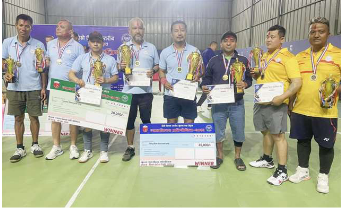
उपाधि विजेता तथा उपविजेता खेलाडीहरू टुफी ग्रहणपछि सामूहिक तस्वीर खिचाउँदै।