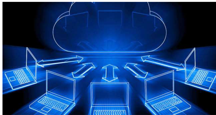
सुरक्षा अपडेटहरू स्वतः प्राप्त हुन्छन् ।

क्लाउड कम्प्युटिङमा धेरै खर्च गरेर धेरै फाइदा लिन सकिन्छ । क्लाउड कम्प्युटिङ सस्तो पनि हुन्छ । क्लाउड कम्प्युटिङको प्रयोग गर्न विशेष हार्डवेयर, सफ्टवेयर केही आवश्यक पर्दैन । यसलाई आफूसँग भएको कुनै पनि डिभाइसबाट सजिलै चलाउन सकिन्छ । कस्ट-इफेक्टिभ (कम लगानी)- हार्डवेयर खरिद गर्नु नपर्ने भएकाले खर्च कम हुन्छ । एकमुष्ट लगानी गर्नु नपर्ने । आवश्यकताअनुसार स्रोतको प्रयोग आन-डिमन्ड सेवा- प्रयोगकर्ताले आवश्यकताअनुसार स्रोत प्रयोग गर्न सक्छन् । प्रयोगअनुसारको मासिक, त्रैमासिक, अर्धवार्षिक या वार्षिक रूपमा रकम भुक्तानी । स्कैलेबिलिटी- लर्चलता - आवश्यकतानुसार स्रोत घटाउन वा बढाउन सकिन्छ । रिमोट एक्सेस- इन्टरनेटको माध्यमबाट जुनसुकै ठाउँबाट सेवा प्रयोग गर्न सकिन्छ । सुरक्षित-आफ्नै नियन्त्रण तथा डाटा नोक्सानी हुनबाट सुरक्षित, ब्याकअपको राम्रो प्रबन्ध । स्वचालित अपडेट- सफ्टवेयर तथा