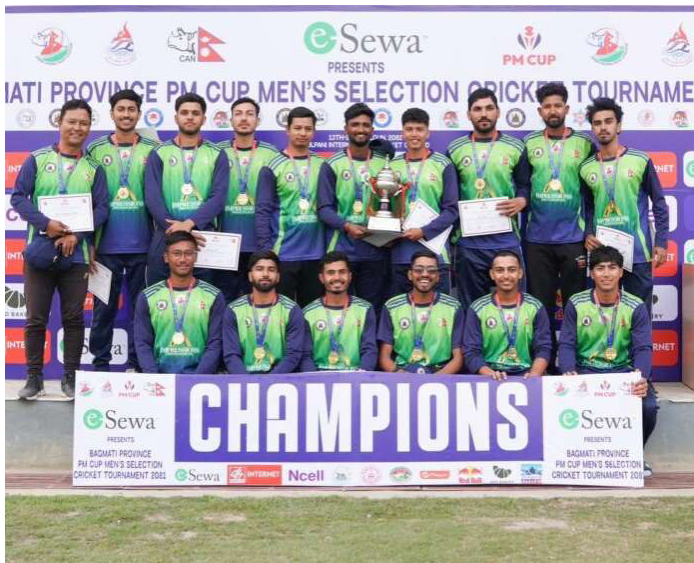
उपाधि विजेता ललितपुरको टिम।