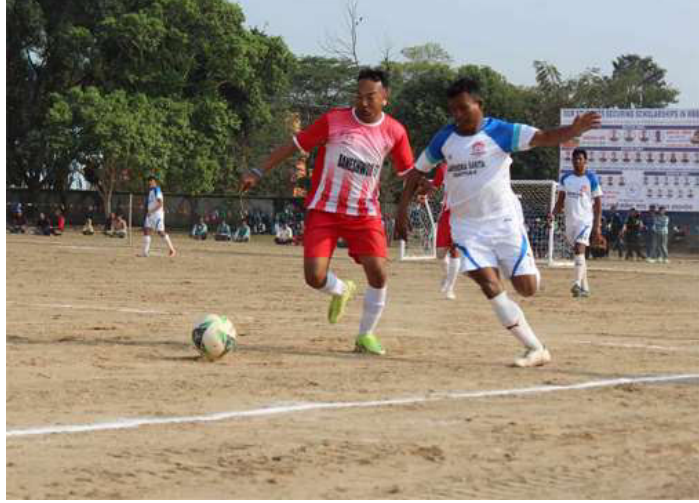
बल नियन्त्रणमा लिने प्रयास गर्दै ।