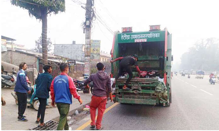
फोहोर संकलन गर्दै हेटौडा उपमहानगरपालिकाका सरसफाई कर्मचारी ।