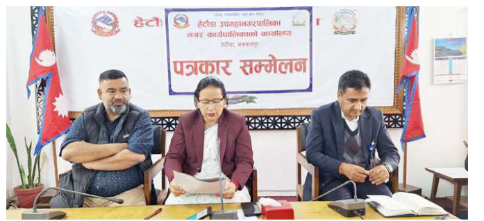
प्रतिशत बालिका रहेका छन् ।

२०७९ सालको घरधुरी तथ्यांक संकलन सर्वेक्षणअनुसार हेटौडा उपमहानगरपालिकामा १८ वर्ष मुनिका ५० हजार एक सय ९५ बालबालिका छन् । २६ हजार १ सय ४५ बालक र २४ हजार ५० बालिका रहेका छन् । कुल बालबालिकाको संख्यालाई आधार मान्दा ५२.०८ प्रतिशत बालक र ४७.९१