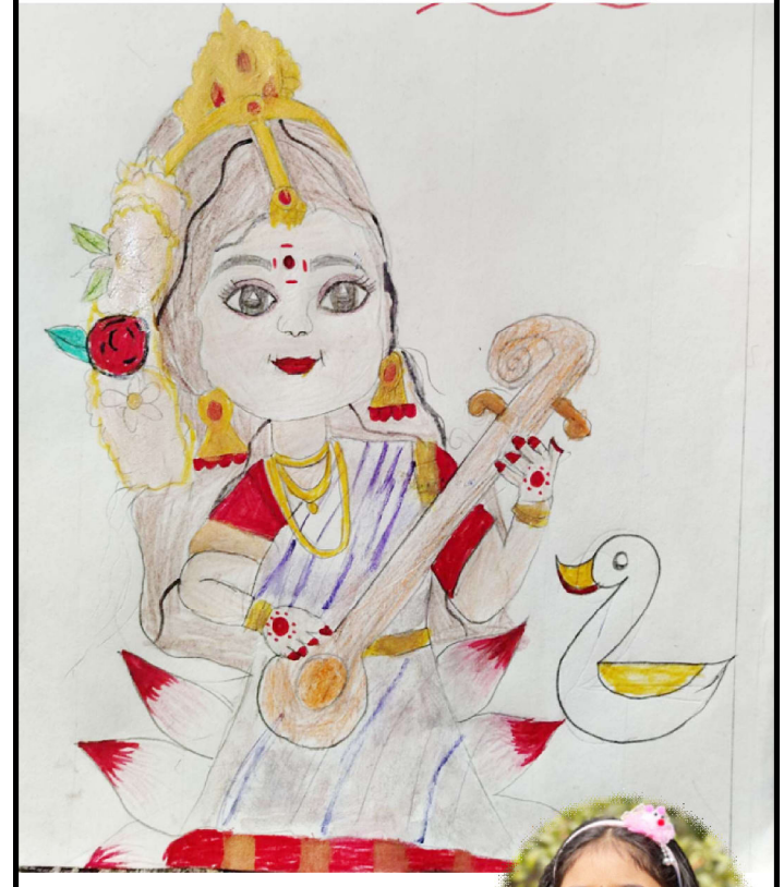
आध्या अर्याल कक्षा-८, ब्रह्मदिक एकेडेमी, हेटौँडा-४