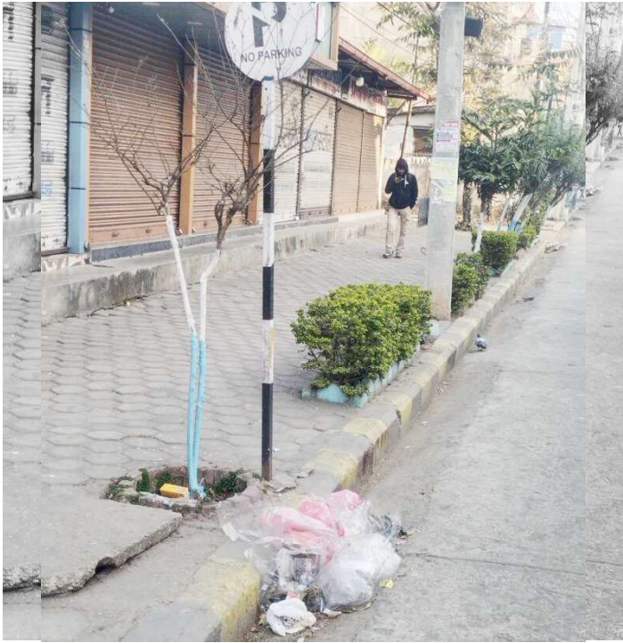
हेटौंडा-४, पारिजातपथमा हेटौंडा उपमहानगरपालिकाका कर्मचारीले थुपारेको फोहोर। समाज संवाददाता हेटौंडा : हेटौंडा बजारको फोहोर उपमहानगरपालिका कर्मचारीले सडकका

फोहोर बडारेर सडकछेउमै थुपारेका हुन्। अदालतले डम्पिङ साइटमा फोहोर नफाल्न अन्तरिम आदेश जारी गरे पछि विहीवारबाट घरधुरीको फोहोर संकलन रोकेको हेटौंडा उपमहानगरपालिकाले शुक्रवारबाट भने मुख्य बजार क्षेत्रको सडकको फोहोर पनि उठाउन छाडेको छ। हेटौंडा बजार क्षेत्रमा हेटौंडा उपमहानगरपालिकाकै कर्मचारीले फोहोर संकलन तथा व्यवस्थापन गर्दै आएको छ भने हेटौंडा नगरका निजी आवास तथा व्यावसायिक क्षेत्रको फोहोर सशुल्क संकलन तथा व्यवस्थापनको जिम्मा निजी क्षेत्रलाई दिइएको छ। अदालतको आदेशपछि हेटौंडा उपमहानगरपालिकाले विहीवार एक सूचना नै जारी गरेर फोहोर संकलन कार्य स्थगित गरिएको जनाएको थियो।