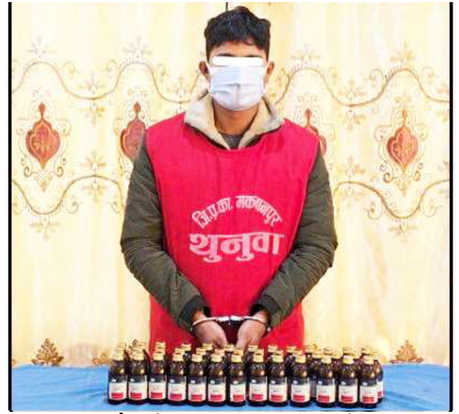
लागूऔषधसहित पक्राउ परेका भारतीय नागरिक।