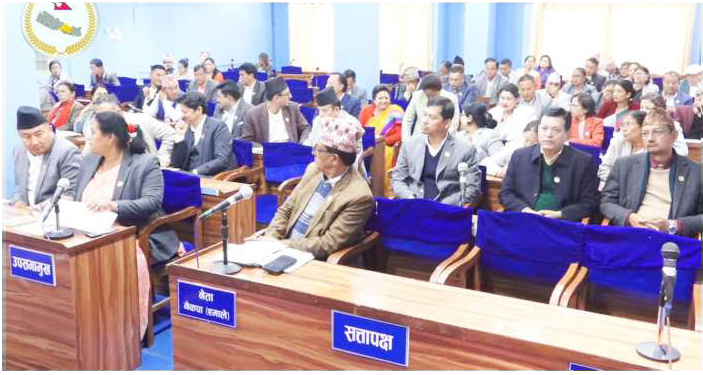
प्रदेश सभा बैठकमा सहभागी ।