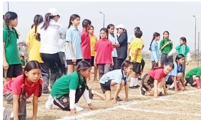
दौड प्रतियोगितामा सहभागी हुँदै विद्यार्थी।