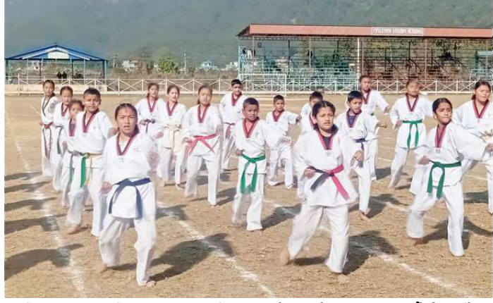
खेलकुद सप्ताहको उद्घाटन समारोहमा मार्सल आर्ट कला प्रस्तुत गर्दै विद्यार्थी ।