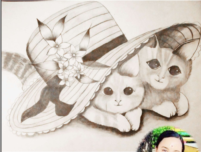
दिपासना थापा कक्षा-११, हेटौडा स्कूल अफ म्यानेजमेन्ट हेटौडा-४