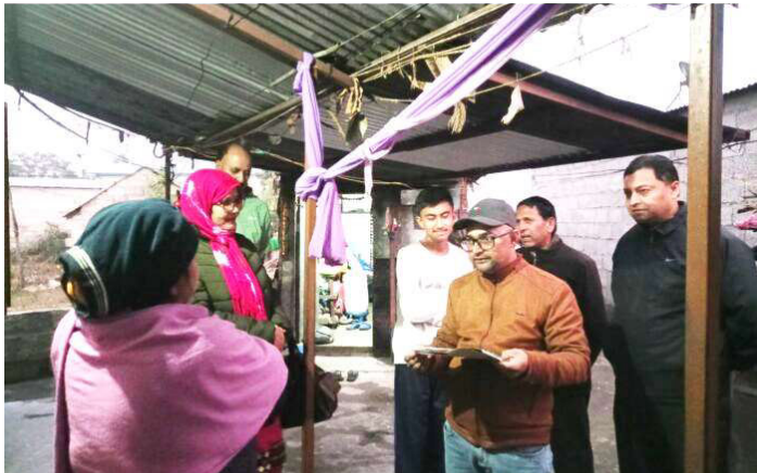
विद्यार्थीको नतीजासहित घरदैलो कार्यक्रममा सहभागी शिक्षकहरु।