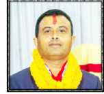
राजकुमार नहर्की वरिष्ठ उपाध्यक्षमा