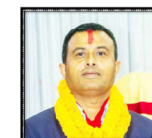
राजकुमार नहर्की वरिष्ठ उपाध्यक्षमा