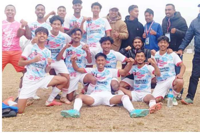
प्रदेश लिग फुटबलमा फाइनलमा प्रवेश गर्ने दोलखाको टिम