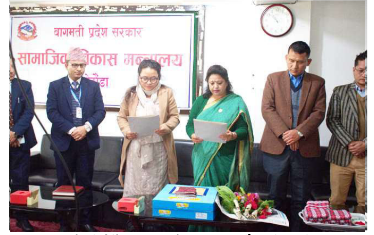
कार्यकारी निर्देशक लामालाई सपथ गराउनुहुँदै मन्त्री खड्गी।