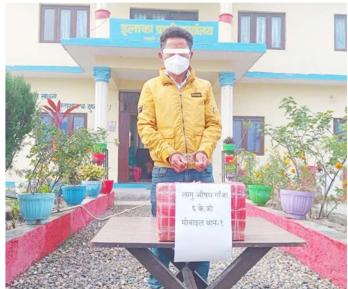
लागूऔषध गाँजासहित पक्राउ परेका मोक्तान ।