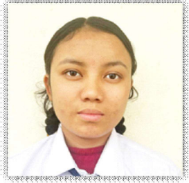
सल्लिना आले मगर