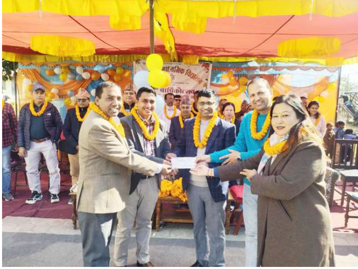
सहयोग रकमको चेक हस्तान्तरण गरिँदै ।