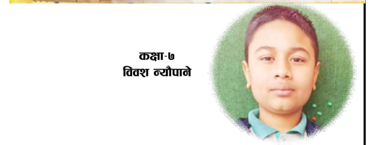
कक्षा-७ विवश न्योपाने