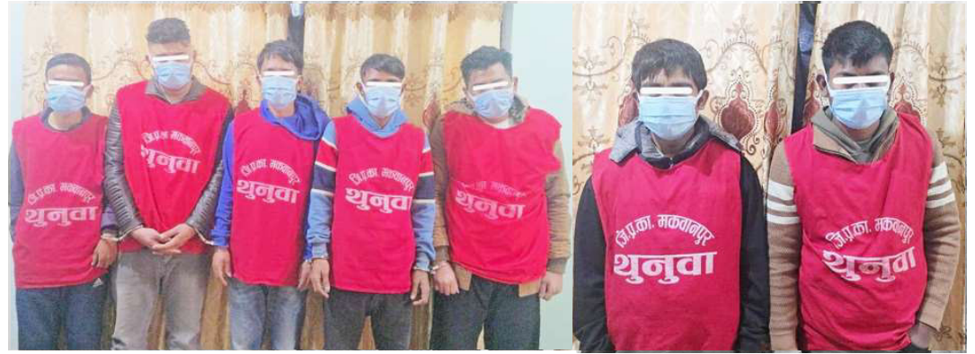
लागऔषध खैरो हेरोइनसहित पक्राउ परेकाहरु।