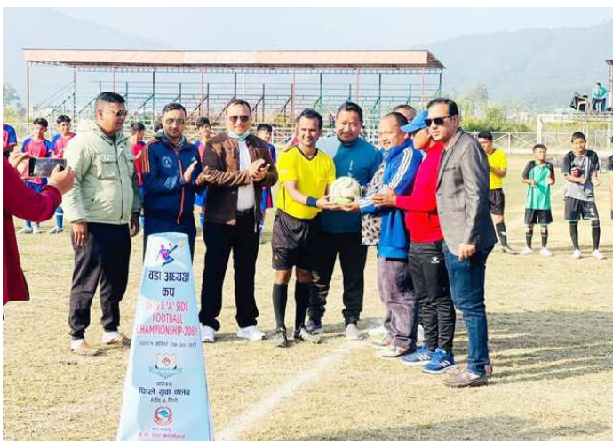
रेफ्रीलाई बल हस्तान्तरण गरेर प्रतियोगिताको उद्घाटन गरिदै ।