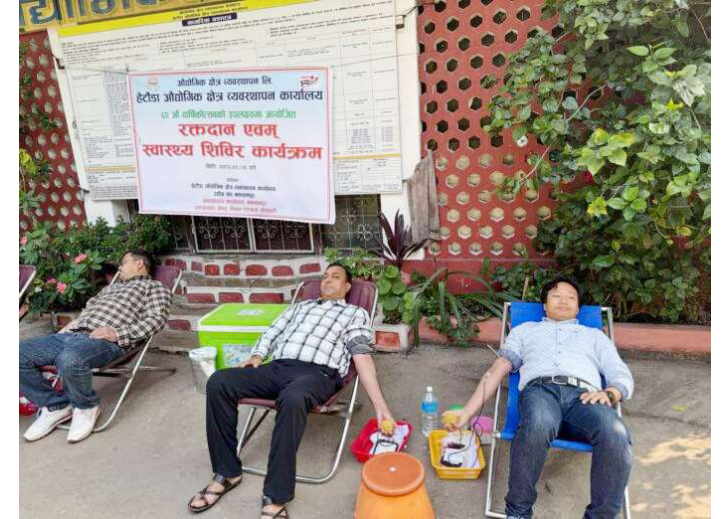
रक्तदान गर्दै रक्तदाता।