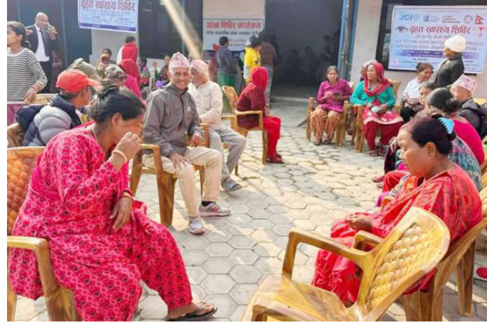
हेटौंडा-३ मा आँखा परीक्षण शिविरमा सहभागीहरू।