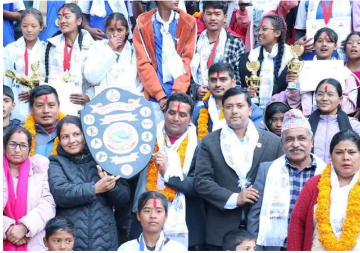
उपाधि साथ महाचुली माध्यमिक विद्यालयको टिम ।