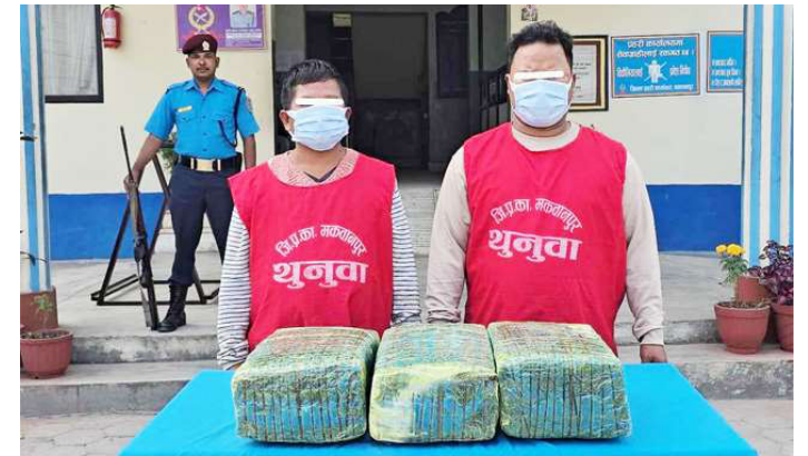
गाँजासहित पक्राउ परेका स्याङ्तान र प्रजालाई सार्वजनिक गर्दै प्रहरी।