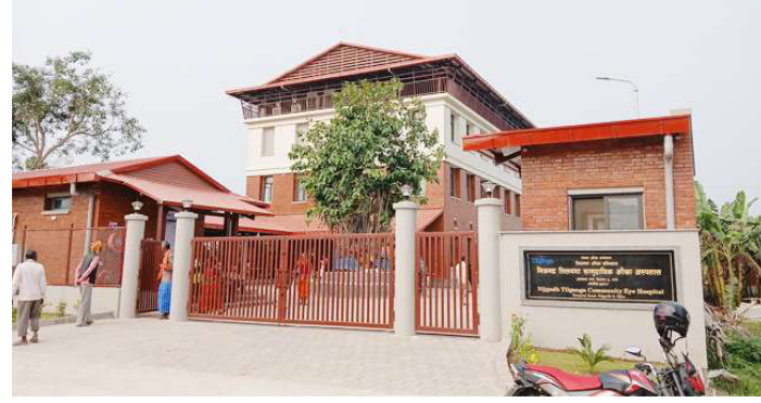
बारा जिल्लाको निजगढ नगरपालिकामा सञ्चालनमा आएको सामुदायिक आँखा अस्पताल।