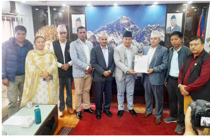
आफ्नो पहिलो सय दिनको कार्यकालको प्रगति विवरण सार्वजनिक गर्नुहुँदै मुख्यमन्त्री लामा ।