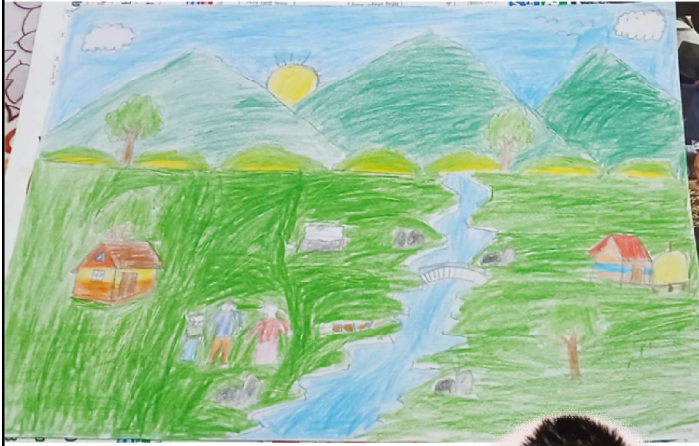
रौनक केवि कक्षा-३, जीएस निकेतन हेटौंडा-४