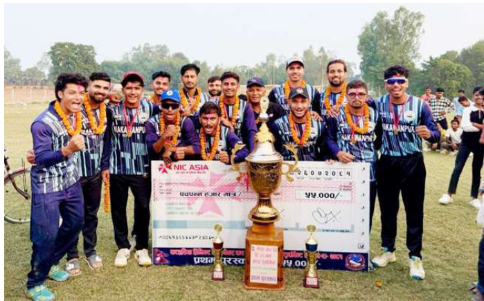
उपाधिसहित मकवानपुर जिल्लाको क्रिकेट टिम ।