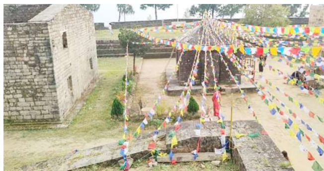
हरिबोधिनी एकादशीका लागि सिंगारिएको मकवानपुरगढी ।