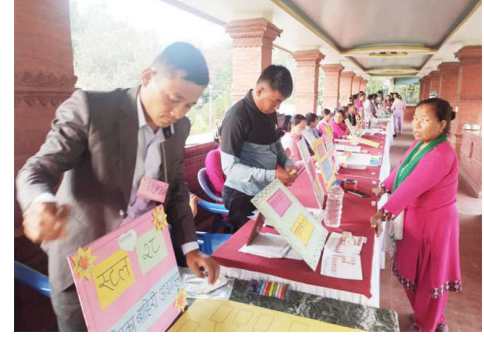
कार्यशालामा निर्माण गरिएको सामग्री प्रदर्शन गर्दै शिक्षकहरू ।