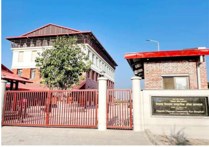
निजगढमा तयार भएको आँखा अस्पताल