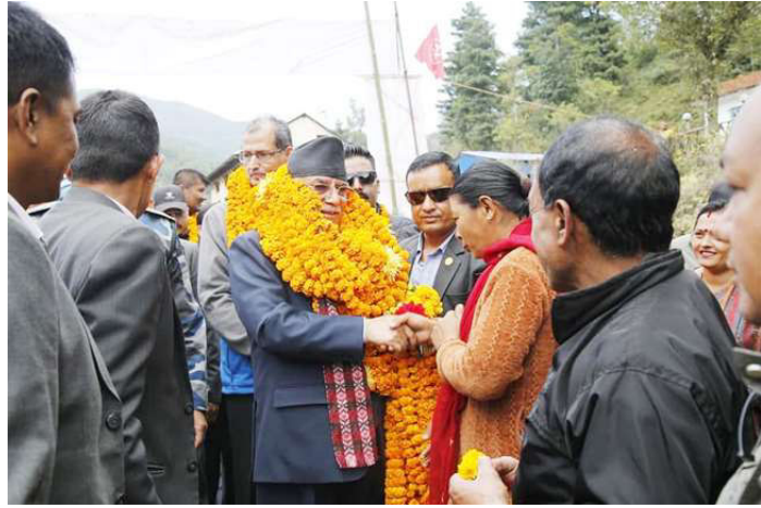
थाहा नगरमा प्रचण्डलाई स्वागत गर्दै स्थानीय नेता, कार्यकर्ता ।