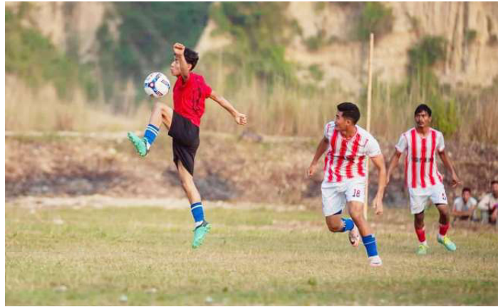
बल नियन्त्रणमा लिने प्रयास गर्दै खेलाडी ।