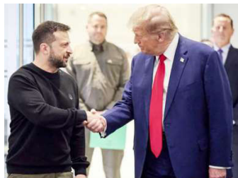
फाइल तस्वीर ।

रुसले २०१४ मा क्राइमिया प्रायद्वीपलाई गाभेको थियो। त्यसको ८ वर्षपछि रुसले युक्रेनमा पूर्ण मात्राको आक्रमण सुरु गरेको हो। राष्ट्रपतिमा