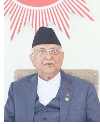
प्रधानमन्त्री केपी शर्मा ओली ।

‘समन्वय राम्रो भइरहेको छ। अझ राम्रो परिस्थिति बनाउन कांग्रेस र हाम्रो संयन्त्र बनाएका हौं’, प्रधानमन्त्रीको भनाइ उद्धृत गर्दै एक नेताले भने। कांग्रेस र एमाले नेताहरू सम्मिलित राजनीतिक संयन्त्रले सरकार सञ्चालनमा सहजीकरण गर्ने प्रधानमन्त्री एवं अध्यक्ष ओलीले बताएका छन्। ‘कांग्रेससँग मिलेर बनेको सरकारले काम गर्ने परिस्थिति सहज बनिरहेको छ। हामी मुलुकको हितमा काम गरिरहेका छौं’, ओलीले बैठकमा भनेका थिए। सरकार सञ्चालनमा अष्टयारो अवस्था आउने वातावरण बनाउन नहुने पनि ओलीले बताएका छन्। अन्तर्राष्ट्रिय परिस्थिति पनि अनुकूल बन्दै गएको प्रधानमन्त्री ओलीले बताएका छन्। ‘चिन्ता गर्नुपर्ने केही छैन, अन्तर्राष्ट्रिय परिस्थिति समेत अनुकूल बन्दै गएको छ’, प्रधानमन्त्रीले भने। प्रधानमन्त्री ओलीले आगामी १७