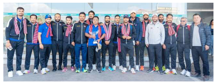
विभूवन अन्तर्राष्ट्रिय विमानस्थलमा नेपाली क्रिकेट टिम। काठमाडौं: आइसिसी विश्वकप लिग-२ अन्तर्गत अमेरिका र क्यानडामा भएको त्रिकोणात्मक शृंखला खेलेर नेपाली क्रिकेट टोली स्वदेश फर्किएको छ। टोली विहीवार स्वदेश फर्किएको हो। नेपालले क्यानडामा घरेलु टोली र

त्यसपछि नेपाली टोली अमेरिका हाँकिएको थियो। अमेरिकामा पनि सोचेजस्तो नतिजा नेपालले हात पार्न सकेन। घरेलु टोलीसँग तीन विकेट र ३७ रनले हार बेहोरेको नेपालले साविक विजेता स्कटल्यान्डविरुद्ध भने पाँच विकेटको जित निकाल्यो। अर्को खेल भने वर्षाको कारण पूरा हुन पाएन र एक अंक नेपालको खातामा जोडियो। लिग-२ को १२ खेल सकिँदा नेपाल ६ अंकसहित तालिकाको पुछारबाट दोस्रो स्थानमा छुन। अब २४ खेल बाँकी रहेदा नेपाललाई गत वर्ष भई ओडिआई मान्यता बचाउन निकै चुनौतीपूर्ण हुने देखिन्छ।