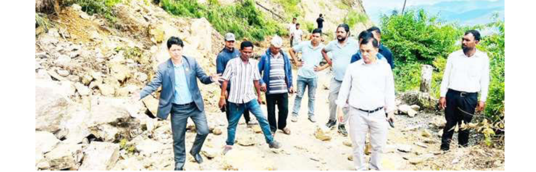
बाढी पहिरो प्रभावित क्षेत्रमा स्थगलतरुपमै खटिनुहुँदै मन्त्री मास्के ।