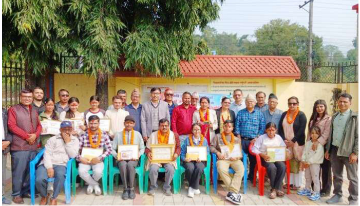
सम्मान तथा पुरस्कार वितरणपछि खिचिएको सामूहिक तस्वीर ।