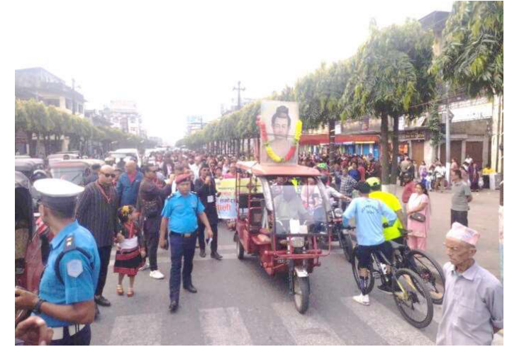
नेपाल सम्वत्को नयाँ वर्षको अवसरमा निकालिएको च्यालीमा सहभागीहरू ।