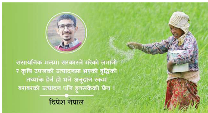
रासायनिक मलमा सरकारले गरेको लगानी र कृषि उपजको उत्पादनमा भएको वृद्धिको तथ्यांक हेर्न हो भने अनुदान रकम बराबरको उत्पादन पनि हुनसकेको छैन ।