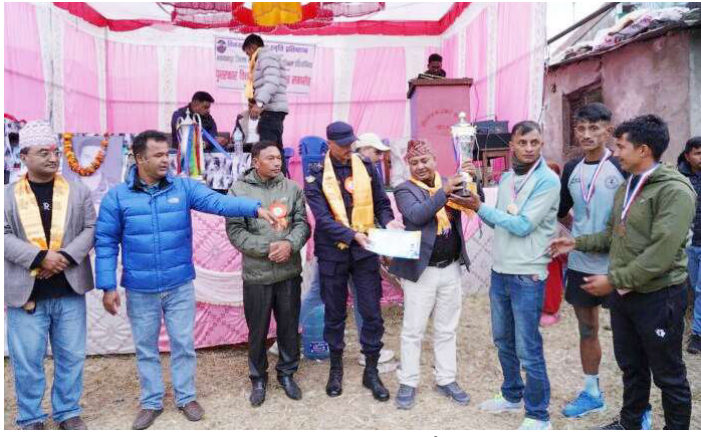
पुरस्कार वितरण गरिँदै ।