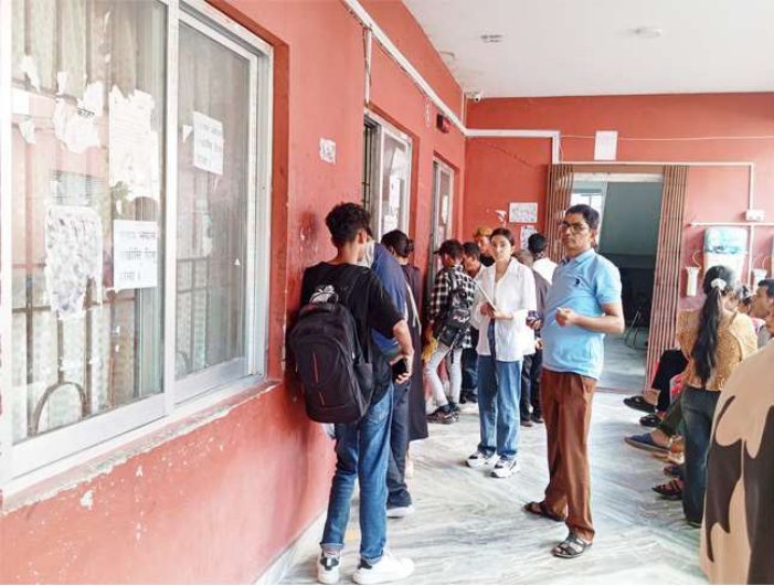
जिल्ला प्रशासनमा सेवाग्राहीको उपस्थिति न्यून ।