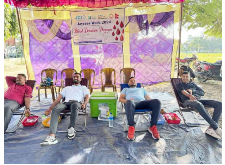
रक्तदान गर्दै रक्तदाता ।