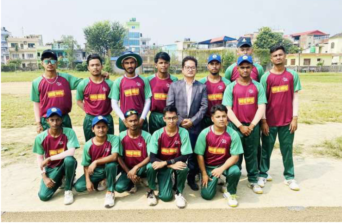
मकवानपुर जिल्ला क्रिकेट टिम ।