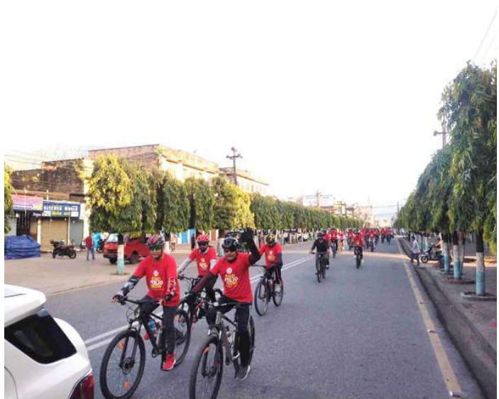
साइकल ज्वालीमा सहभागीहरू ।