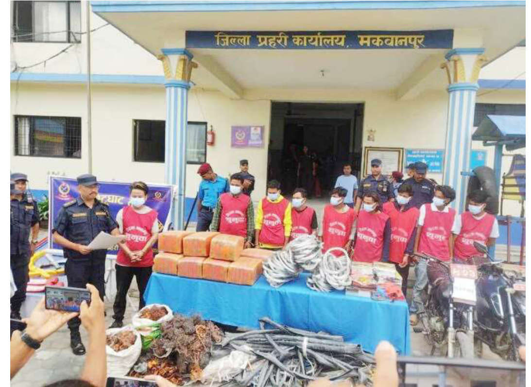
लागुऔषध गाँजा तस्करी र चोरीका घटनामा संलग्नहरूलाई बरामद भएका सामग्रीसहित सार्वजनिक गर्दै।