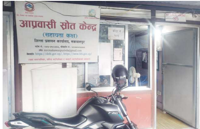
जिल्ला प्रशासन कार्यालय मकवानपुर परिसरमा रहेको आप्रवासी स्रोत केन्द्र ।