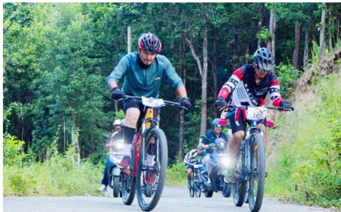
साइक्लिड प्रतियोगितामा सहभागीहरू ।