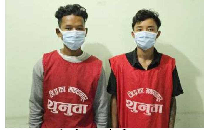
लागुऔषधसहित पक्राउ परेका डिम्डुङ र रुम्बा।