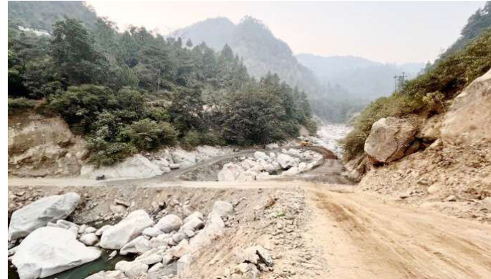
सिमखोलामा निर्माण गरिएको सडक।