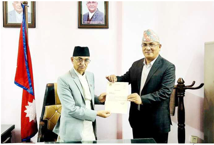
प्रदेश प्रमुख देपकोटासँग प्रदेश लोकसेवा आयोगको अध्यक्षको नियुक्ति बृहन्नुहँदै श्रेष्ठ।