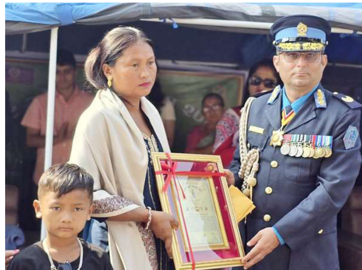
अमर प्रहरी परिवारलाई सम्मान गरिँदै ।