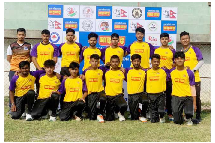
ललितपुर जिल्लाको यु-१९ क्रिकेट टिम।