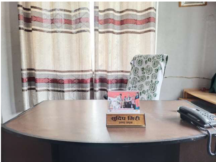
शिक्षा विकास तथा समन्वय इकाई मकवानपुरका प्रमुख अनुपस्थित रहनुहुँदा खाली कुर्सी।