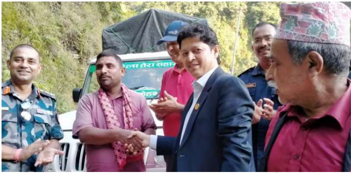
सडक सञ्चार भएपछि चालकलाई खादा ओढाएर सवारी खुलाउनु हुँदै मन्त्री मास्के।