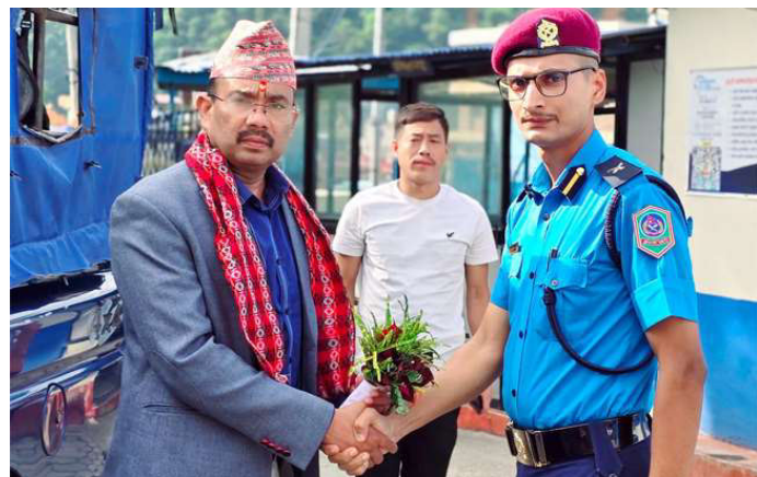
सोमवार जिल्ला प्रहरी कार्यालयमा हाजिर हुनुभएका प्रहरी उपरीक्षक खड्कालाई स्वागत गर्दै प्रहरीहरु।