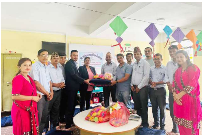
सहयोग सामग्री हस्तान्तरण गरिँदै।