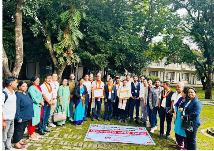
समीक्षापछि सामूहिक तस्वीर खिचाउँदै ।