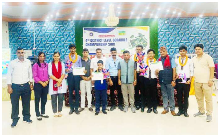
स्क्राबल च्याम्पियनसीपमा उत्कृष्ट ५ मा पर्न सफल विद्यार्थीलाई पुरस्कृत गरेपछि सामूहिक तस्वीर खिचाउँदै।