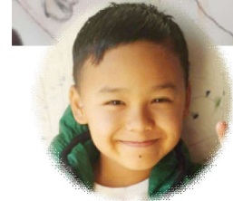
सम्मान घलान कक्षा-४, ब्रह्मदिक एकेडेमी हेटौँडा-४