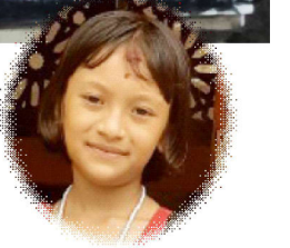
समृद्धि श्रेष्ठ कक्षा-३, ब्रह्मदिक एकेडेमी हेटौँडा-४