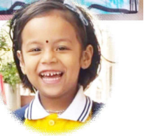
सुष्टि श्रेष्ठ युकेजी लिटिल बडी प्रिस्कूल हेटौँडा-४