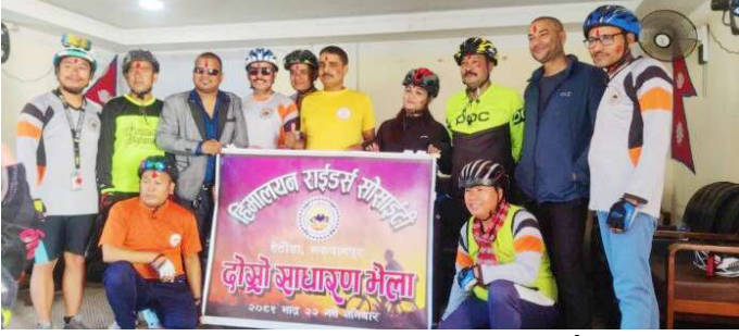
नयाँ समिति चयनपछि सामूहिक तस्वीर खिचार्दै ।