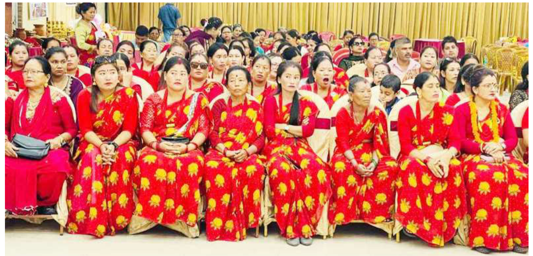
तिजको अवसरमा आयोजित स्थानीय उत्पादन प्रदर्शनी तथा व्यापार मेलाका सहभागी महिलाहरू।