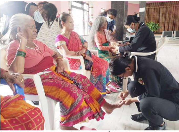
ज्येष्ठ नागरिकको स्याहार गर्दै विद्यार्थी ।

समाज संवाददाता साइन्सेसमा कक्षा १२ मा अध्ययनरत हेटौंडा: हेटौंडा-४ स्थित हेटौंडा स्कूल कालिदास सेक्सन र व्युटिसियन विषय अफ म्यानेजमेन्ट एण्ड सोसियल अध्ययनरत विद्यार्थीको समूहले बुबाको