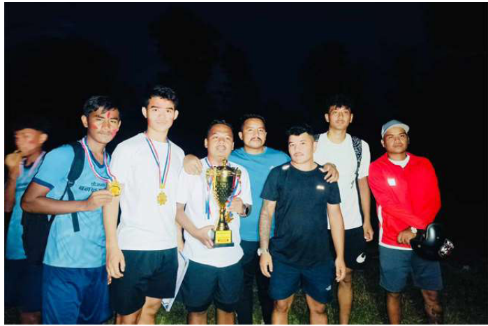
उपाधिसहित मेन्था क्लबको टिम ।