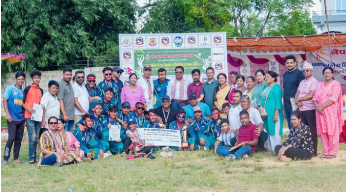
उपाधि साथ आयोजक टिम ।