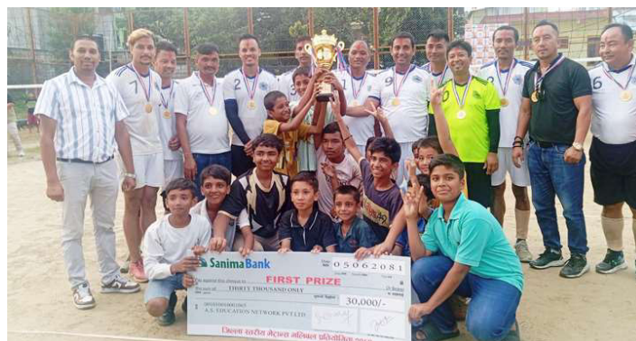
उपाधि साथ नारायणी कलेजको टिम ।